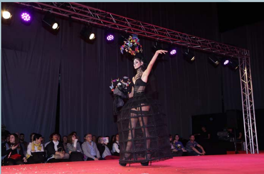
1er Premio Concurso Maquillaje Facial