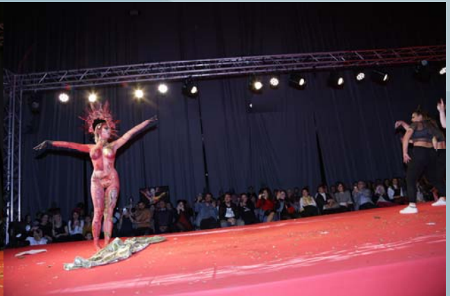
3er Premio Concurso Maquillaje Corporal