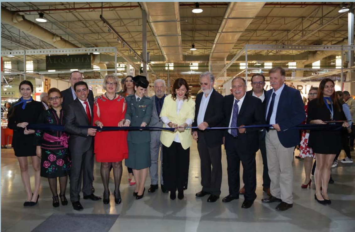
Inauguración oficial de Jesal-Extetic