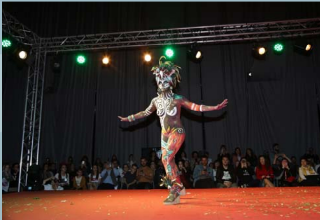
2º Premio Concurso Maquillaje Corporal