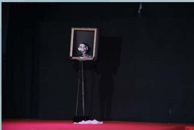
2º Premio Concurso Maquillaje Facial