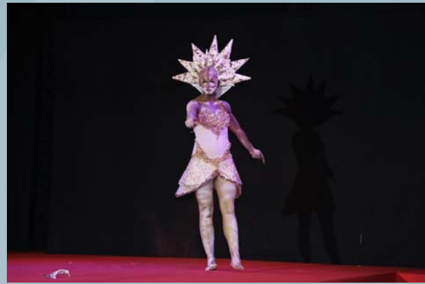
3er Premio Concurso Maquillaje Caracterización