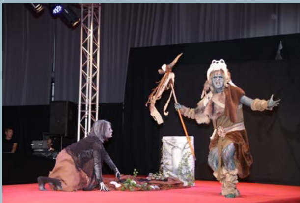
2º Premio Concurso Maquillaje Caracterización