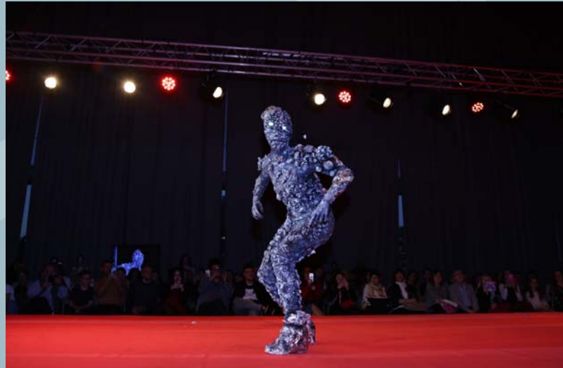
1er Premio Concurso Maquillaje Caracterización