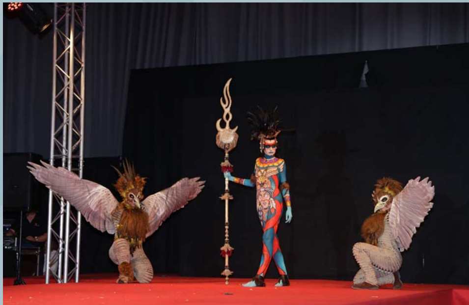
1er Premio Concurso Maquillaje Corporal