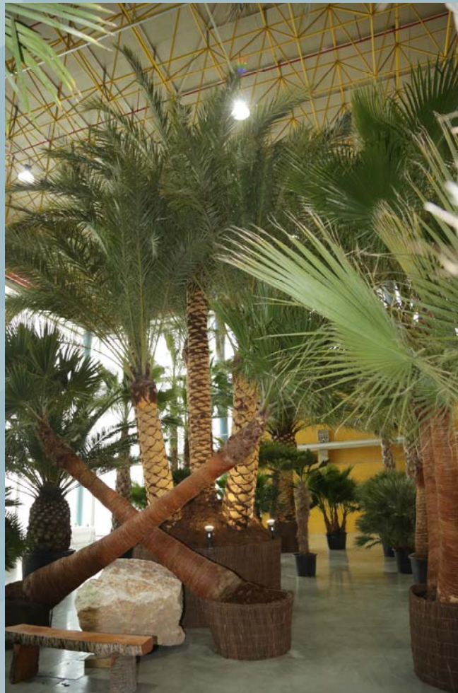
EXCAVACIONES ILICITANAS COVES

El galardonado con el 1er Premio Planta Excepcional ha sido una – Phoenix Dactylopera de 6 troncos –, perteneciente a EXCAVACIONES ILICITANAS COVES . Pieza de 8 metros de tronco y una edad aproximada de 25 años.