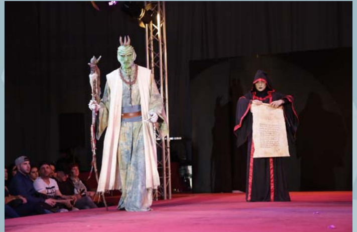
3er Premio Concurso Maquillaje Caracterización