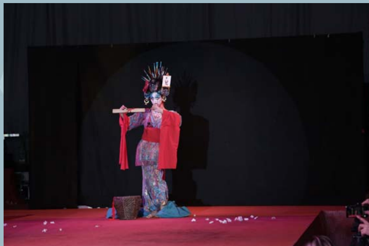
3er Premio Concurso Maquillaje Facial