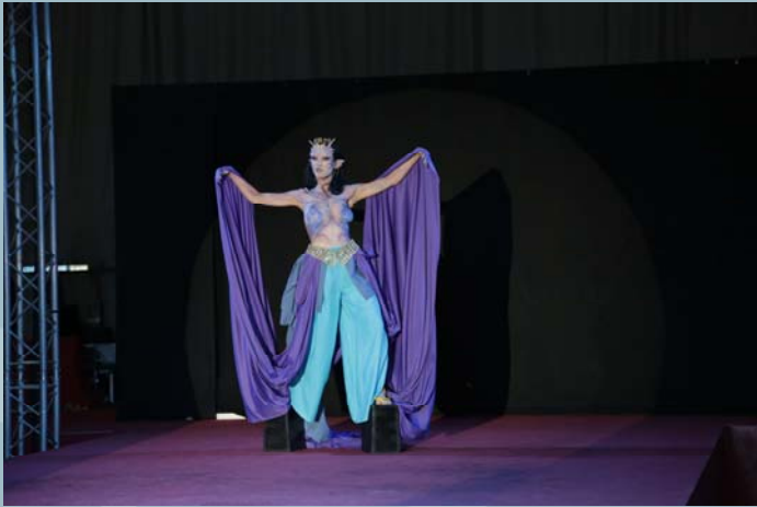
2º Premio Concurso Maquillaje Caracterización