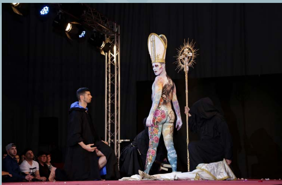
1er Premio Concurso Maquillaje Corporal