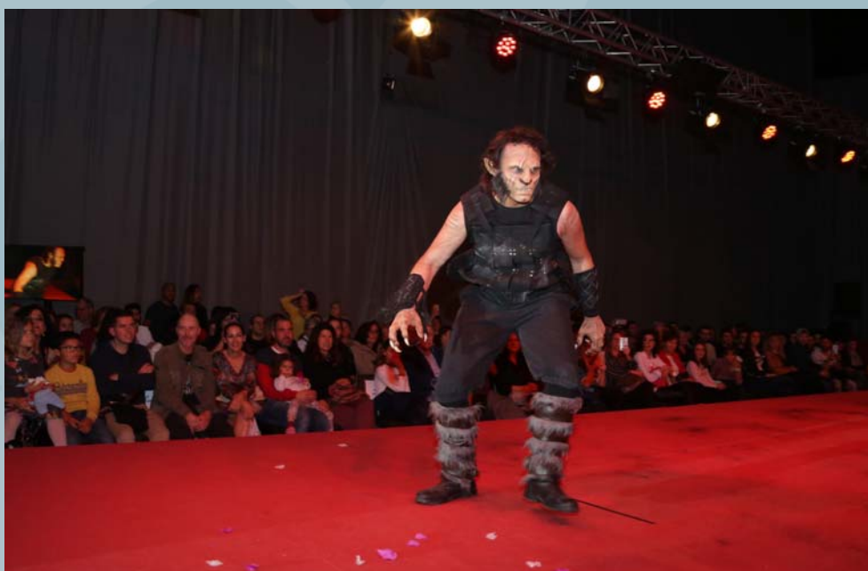
1º Premio Concurso Maquillaje Caracterización