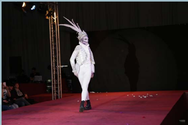
2º Premio Concurso Maquillaje Facial