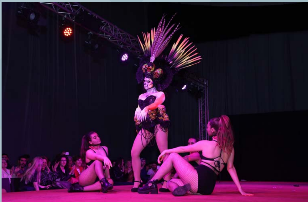
1er Premio Concurso Maquillaje Facial