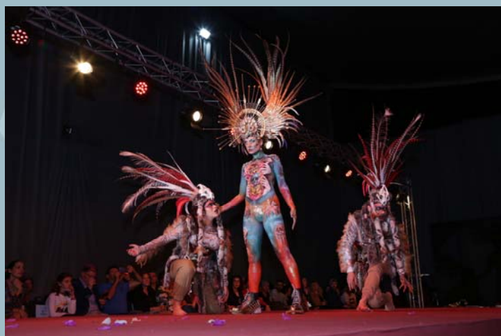
3º Premio Concurso Maquillaje Corporal