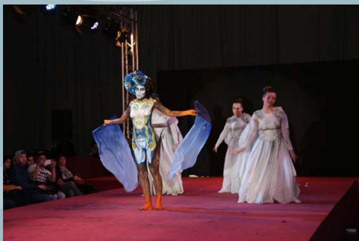
2º Premio Concurso Maquillaje Corporal