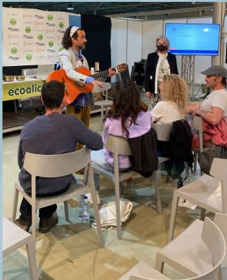
LA AVENTURA DE LA RISA