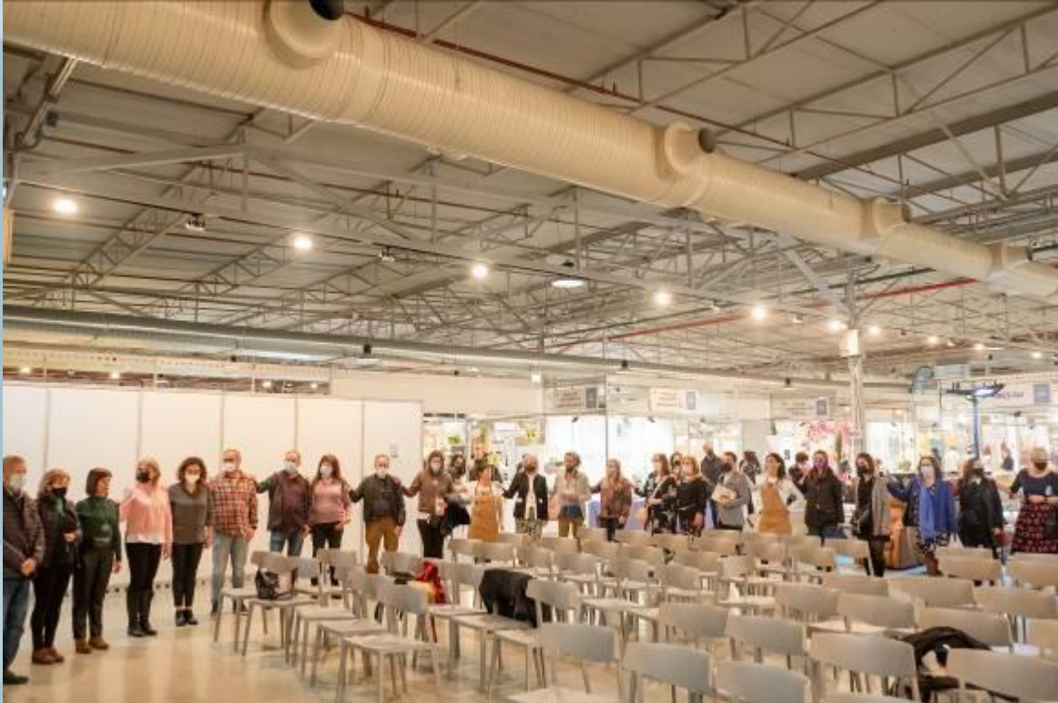
RUEDA DE ENERGIA