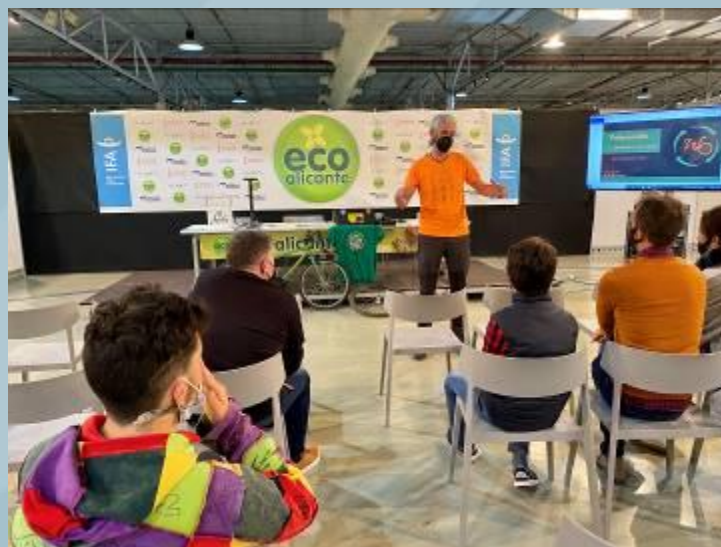
VELOTALLER DE MECANICA BASICA