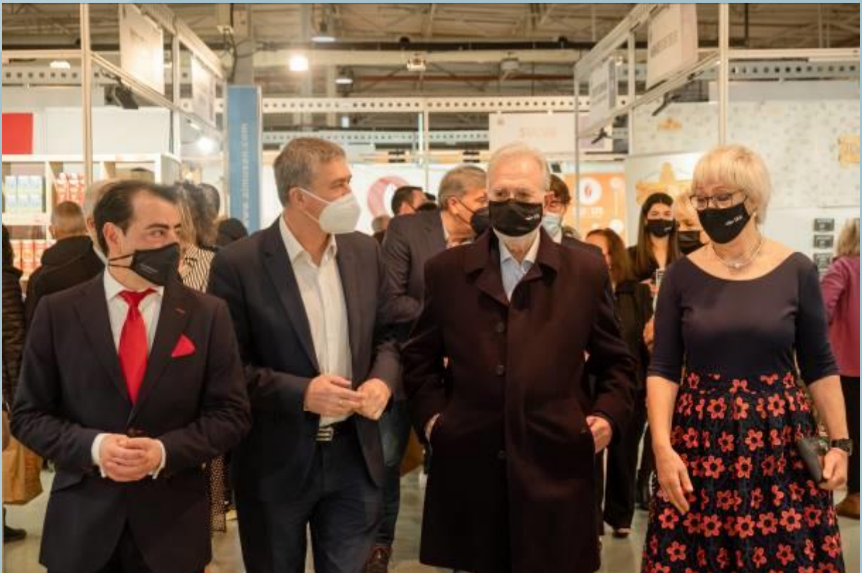
INAUGURACION OFICIAL DE ECOALICANTE Y JESAL EXTETIC