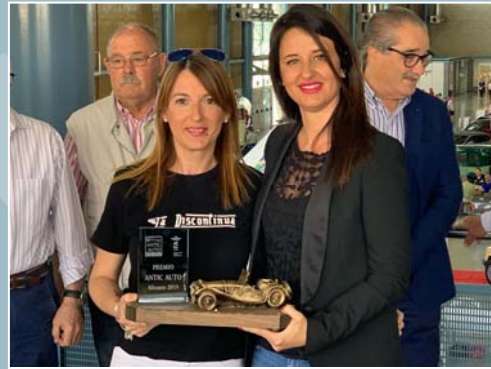
Club Clásicos La Discontinua San Isidro

Se hizo entrega del PREMIO ANTIC AUTO ALICANTE a la Federación de Vehículos Históricos de la Comunidad Valenciana (FVHCV) y al Club Clásicos La Discontinua San Isidro con el fin de agradecer su colaboración en el certamen.