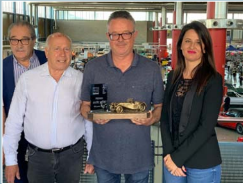
Federación de Vehículos Históricos de la Comunidad Valenciana (FVHCV)